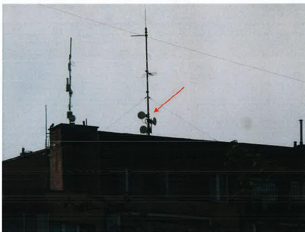
Widok instalacji radiokomunikacyjnej Stacja Netia BIALB081 - BIALM00057 Białystok, ul. Generała Władysława Sikorskiego 4.