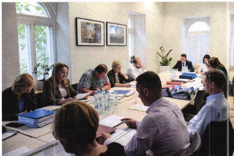
Zdjęcie 6. Posiedzenie Zespołu ds. Budżetu Obywatelskiego w Białymstoku na 2023 rok

Zespół obradował na posiedzeniach prowadzonych przez Przewodniczącego. Rozstrzygnięcia podejmowano w głosowaniu jawnym, zwykłą większością głosów, w obecności co najmniej połowy składu. Protokoły z posiedzeń Zespołu opublikowane zostały na stronie www.cas.bialystok.pl .