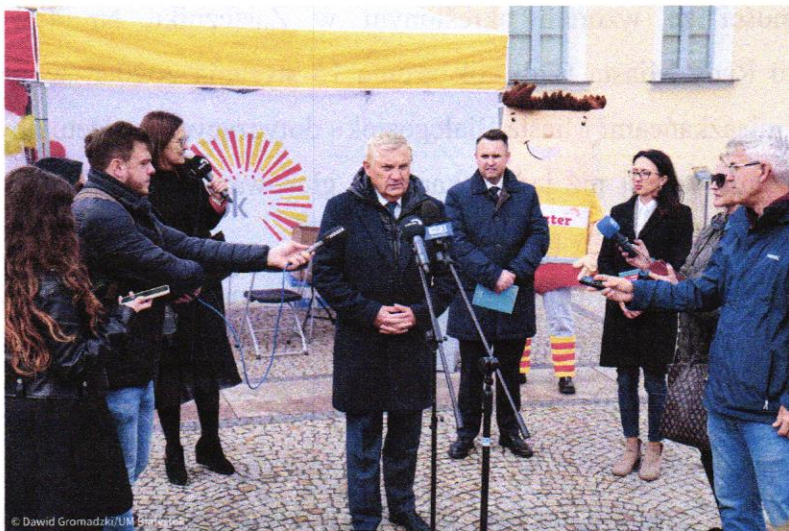
Zdjęcie 7. Konferencja prasowa przed punktem mobilnym do głosowania na Rynku Kościuszki.