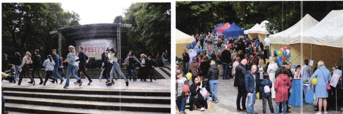
Zdjęcie 3, 4. VI Białostocki Festyn Obywatelski odbył się 18 września 2022 r.