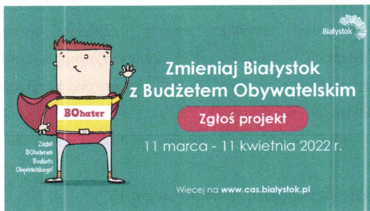
Zdjęcie 1. Banery promujące Budżet Obywatelski 2023 pojawiły się w przestrzeni miejskiej, zostały zamontowane na ogrodzeniach szkół i przedszkoli publicznych.