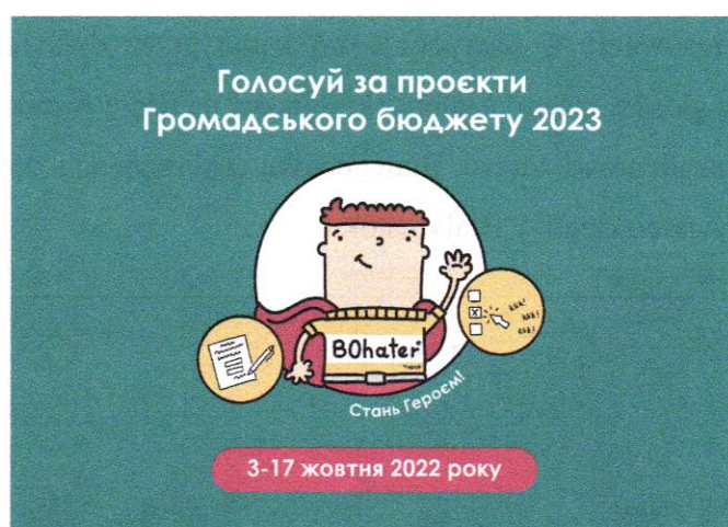
Zdjęcie 5. Materiały informacyjne zostały przetłumaczone na j. ukraiński.