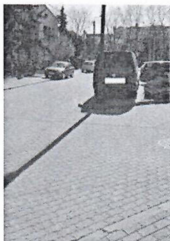
13.jpg 313 KB