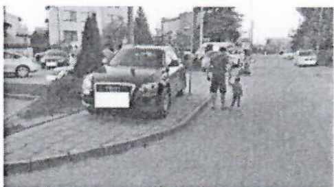
18.jpg 285 KB