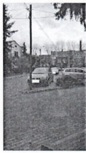
1.jpg 293 KB

w załączniku przesyłam treść petycji dotyczącej zamontowania barierek uniemożliwiających nielegalne parkowanie na chodnikach przy ulicy Aleksandra Karpowicza. Do petycji są dołączone zdjęcia obrazujące całą sytuację Pozdrawiam