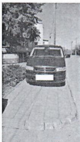
12.jpg 316 KB