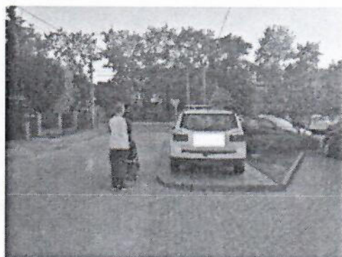
14.jpg 362 KB