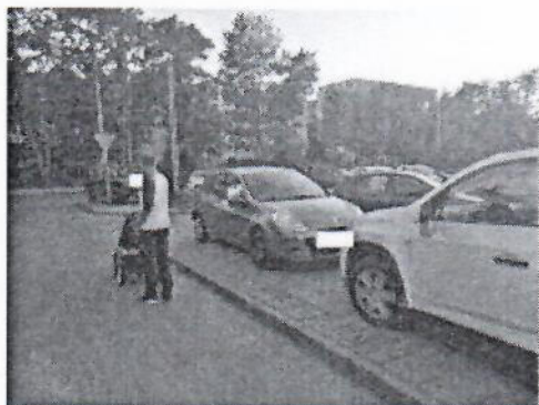
15.jpg 337 KB