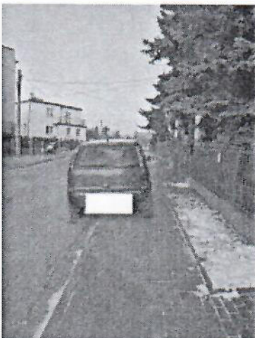
5.jpg 338 KB