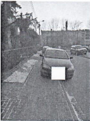
4.jpg 348 KB