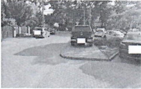
20.jpg 395 KB