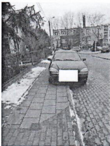
6.jpg 476 KB