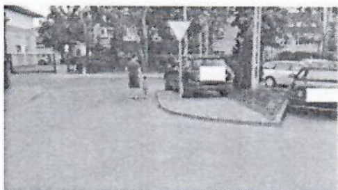
16.jpg 309 KB