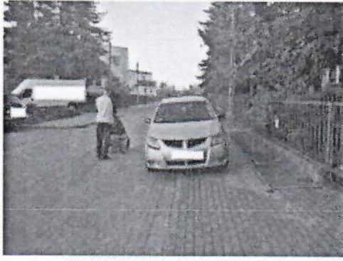
19.jpg 361 KB