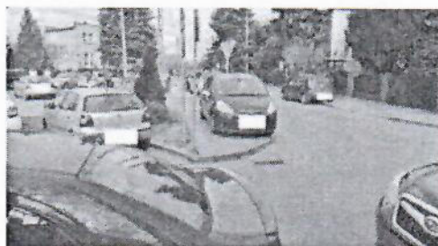
9.jpg 338 KB