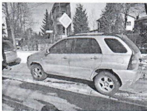
8.jpg 529 KB