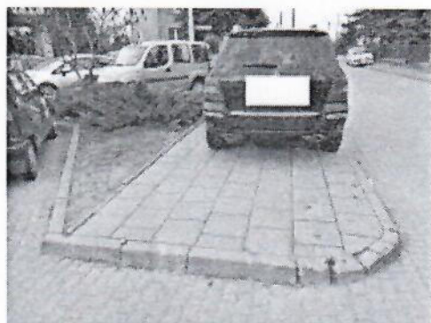
11.jpg 450 KB