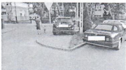
17.jpg 265 KB