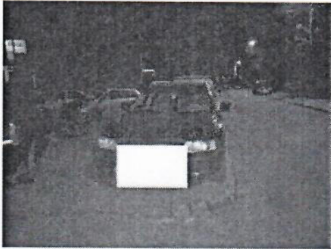
3.jpg 153 KB