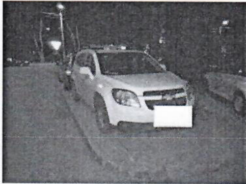
2.jpg 160 KB