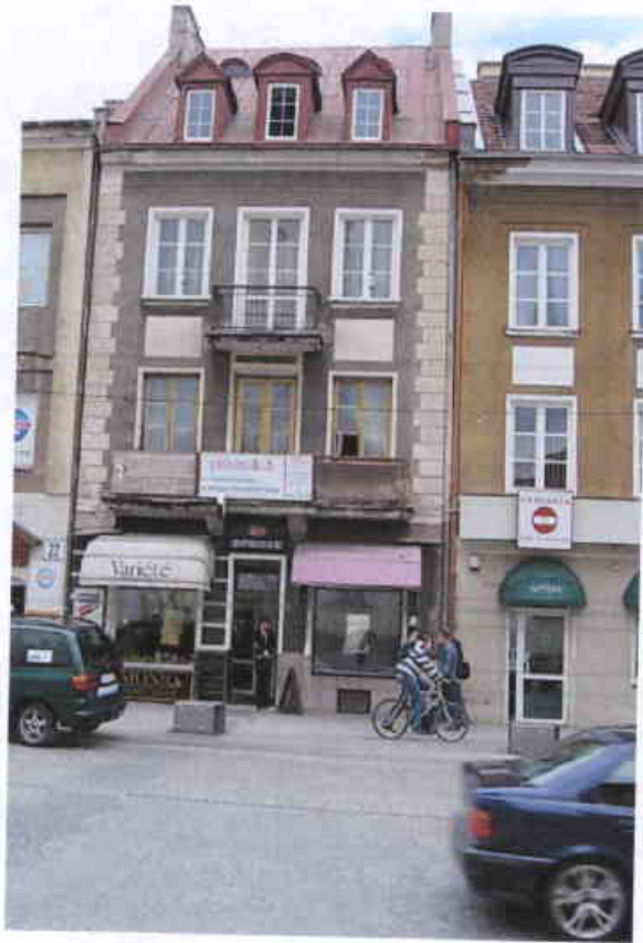
Rynek Kościuszki 20