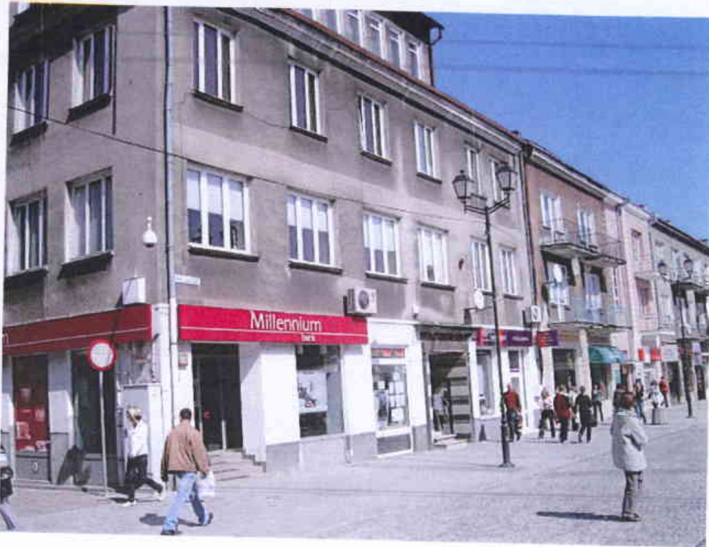
Rynek Kościuszki 30 – 2009 r.