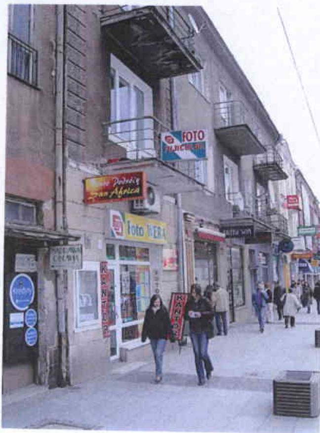
Rynek Kościuszki 28 – 2008 r.