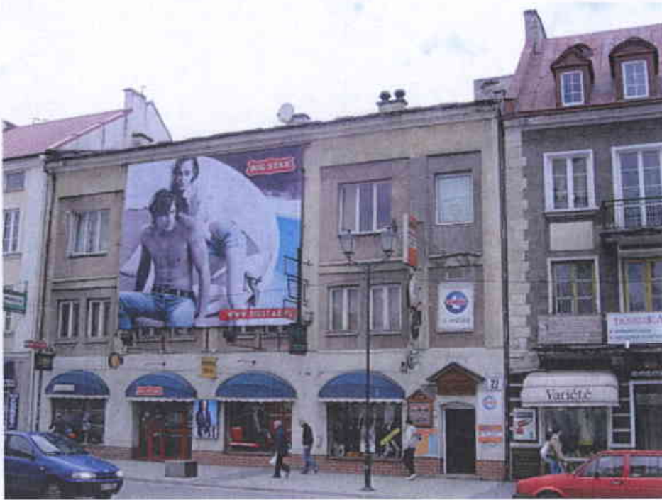
Rynek Kościuszki 22