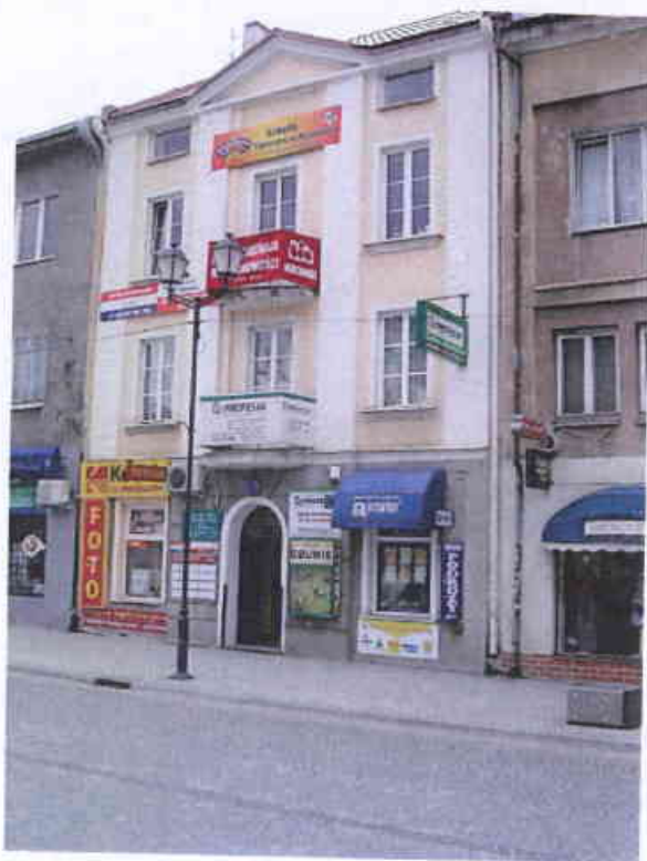
Rynek Kościuszki 24