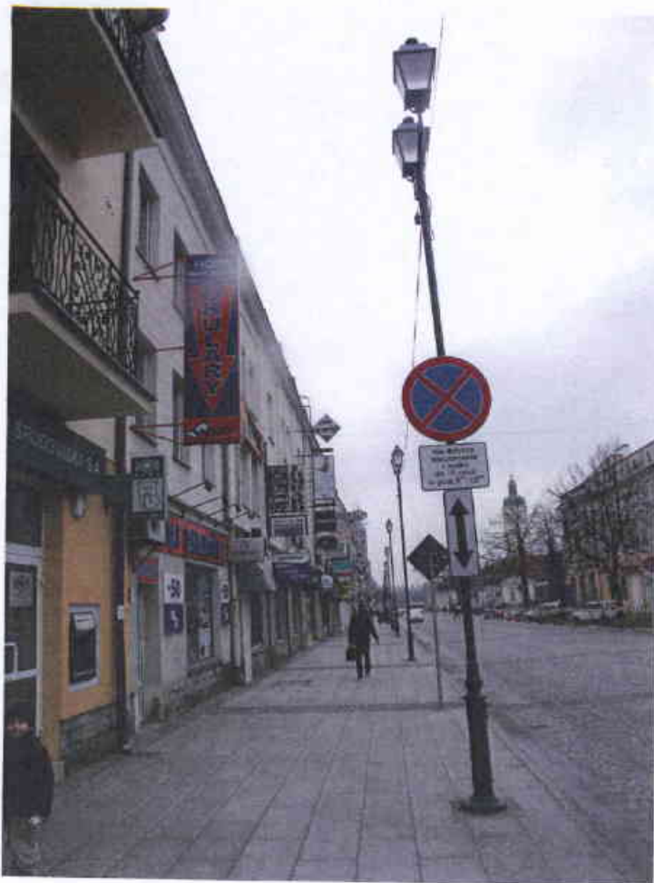
Ulica Lipowa 4 – 2008 r.