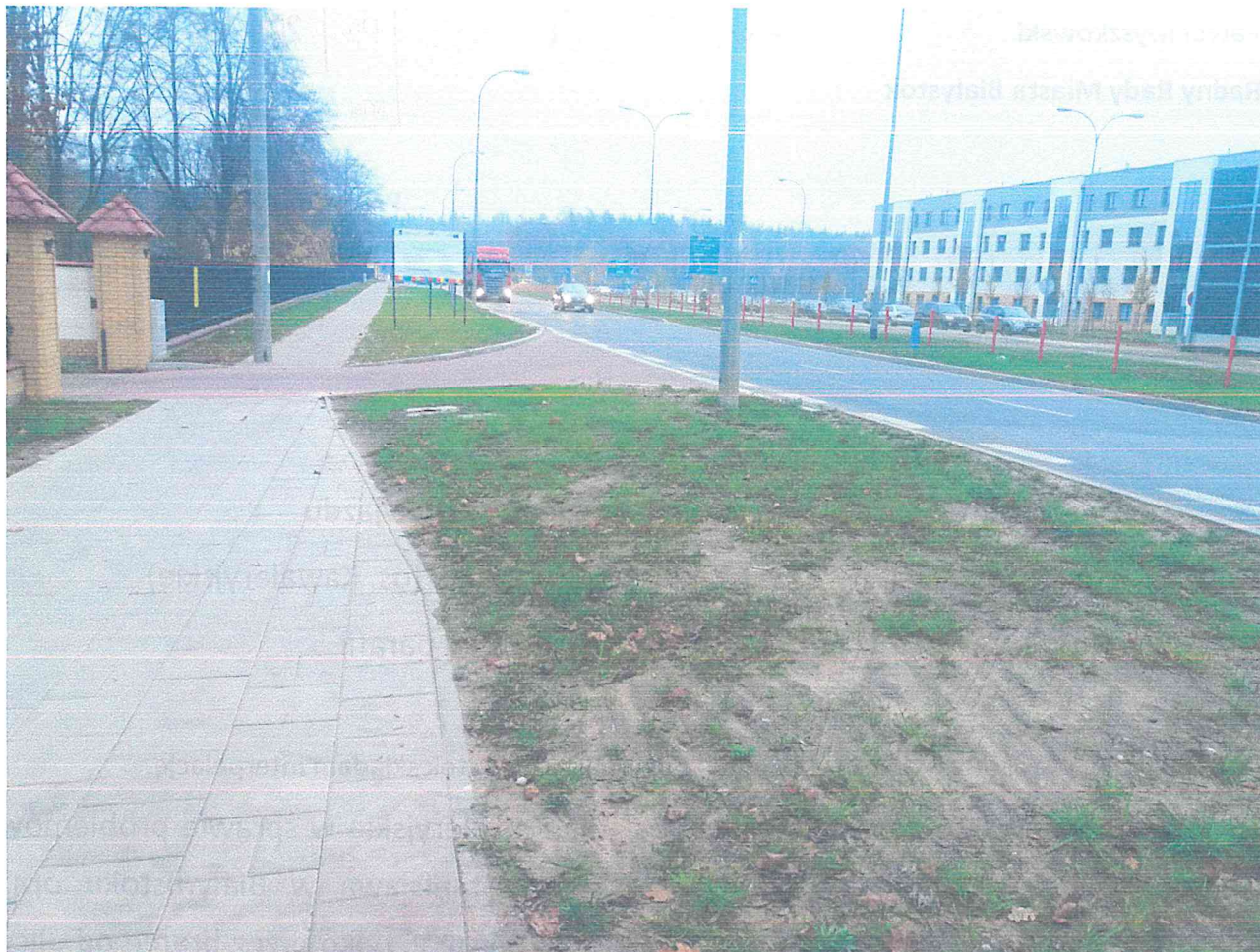
Ulica Widok – zdjęcie od strony Kleosina.

terenu wyjeżdżają. Szczególnie, że wyjazd jest dość stromy, a żeby wjechać na pas ruchu, należy skręcić o 90 stopni na krótkim odcinku jezdni.