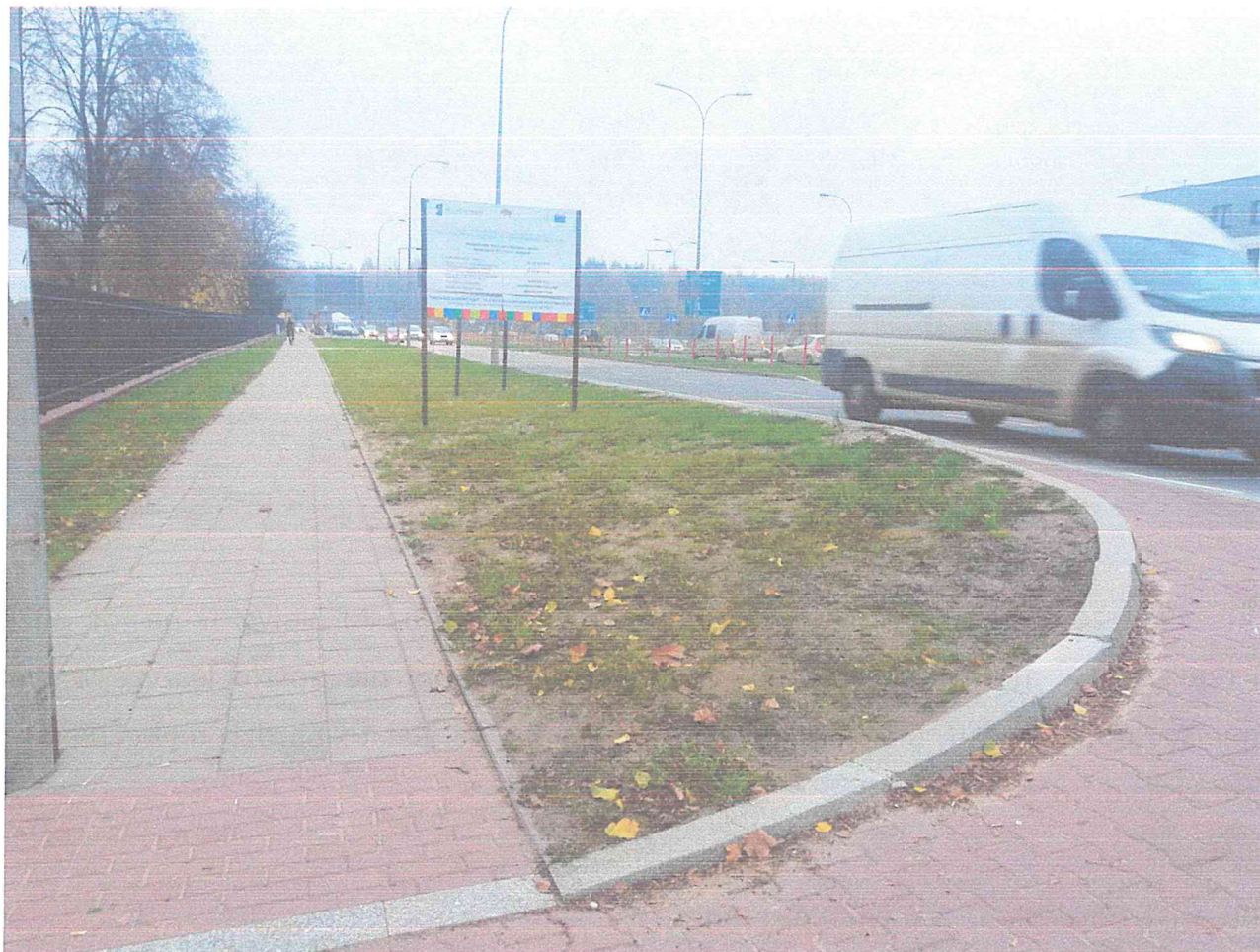
Ulica Widok – zdjęcie spod bramy parafii w stronę centrum.

Widać różnicę poziomów między bramą a jezdnią oraz ostry zakręt na wjeździe/wyjeździe.