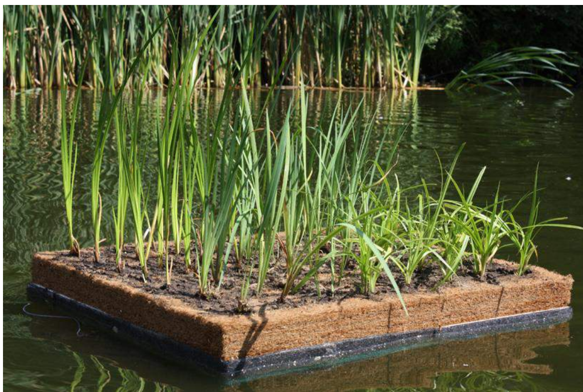
Rysunek 2 Pływająca platforma dla ptactwa wodnego.