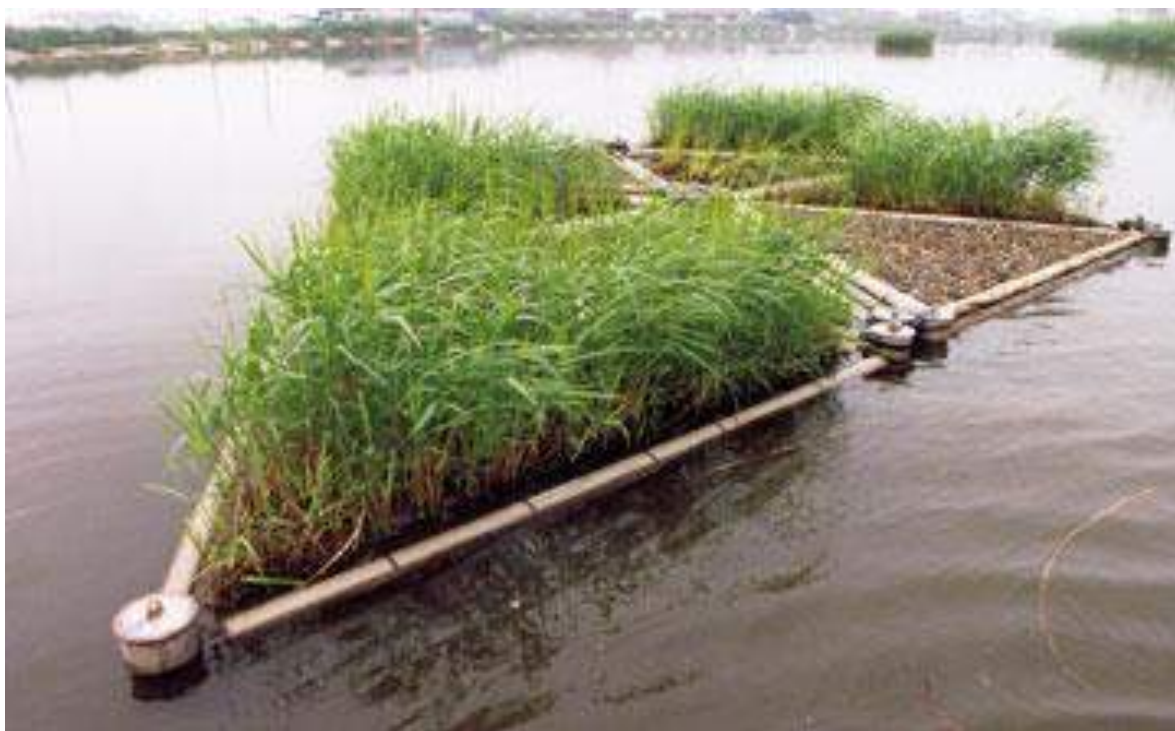
Rysunek 1 Pływająca platforma dla ptactwa wodnego.