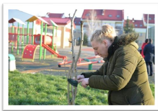
Na fotografiach: realizacja zadania pt.: „Aktywni sąsiedzi”