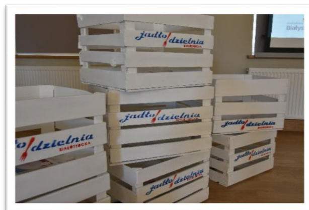
Na fotografiach: realizacja zadania pt.: „Jadłodzielnia w Białymstoku” (powyżej) i „Aktywni sąsiedzi” (poniżej)