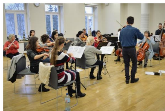
Na fotografiach: inicjatywy realizowane w siedzibie Centrum Aktywności Społecznej przy ul. Św. Rocha 3