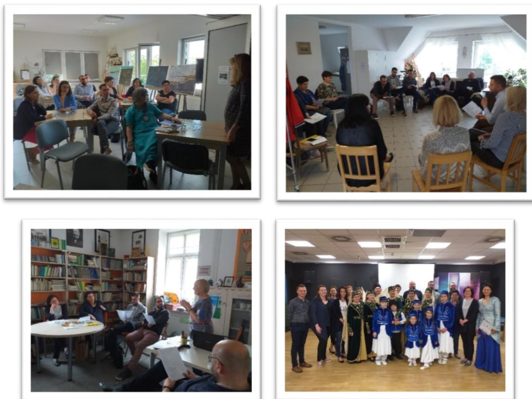
Na fotografiach: posiedzenie Komisji Unii Metropolii Polskich ds. Obywateli Miasta w Białymstoku

Do statutowych zadań Unii Metropolii Polskich należy m.in. wspieranie rozwoju samorządności terytorialnej i gospodarczej, promocja inicjatyw oraz działań związanych z tworzeniem i funkcjonowaniem struktur regionalnych i lokalnych, wspólne rozwiązywanie specyficznych problemów wielkich miast, a także współpraca z organami państwa, organizacjami ogólnopolskimi, zagranicznymi i międzynarodowymi dla zwiększenia roli metropolii w państwie oraz integracji europejskiej. Zadania te realizowane są poprzez organizowanie konferencji, seminariów, konwersatoriów i konsyliów dla polityków i ekspertów, prowadzenie analiz i wydawanie publikacji. 21-22 maja członkowie Komisji Unii Metropolii Polskich ds. Obywateli Miasta odbyli posiedzenie wyjazdowe w Białymstoku.