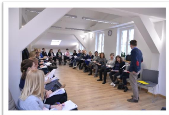
Na fotografiach: inicjatywy edukacyjne adresowane do organizacji pozarządowych