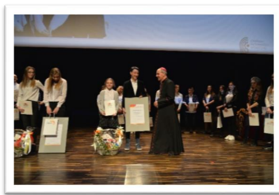
Na fotografiach: Gala białostockiej edycji Samorządowego Konkursu Nastolatków „Ośmiu Wspaniałych”