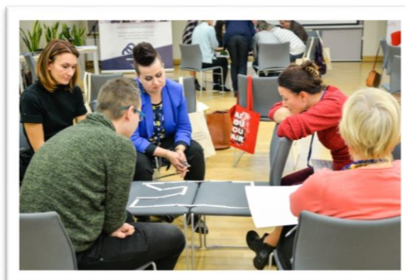
Na fotografiach: Forum Organizacji Pozarządowych Miasta Białystok „Nowe Wyzwania”