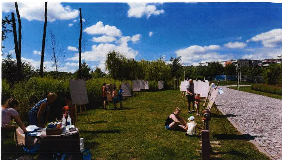
Projekt Fundacji Palace „Namaluj swój świat”