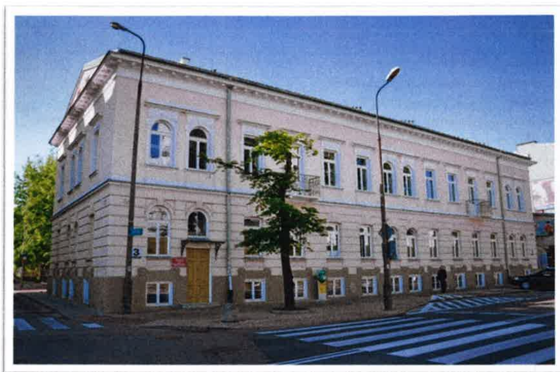
Budynek Centrum Aktywności Społecznej przy ul. św. Rocha 3