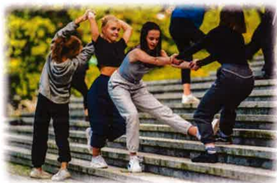
Festiwal KALEJDOSKOP 2020 - XVII edycja realizator: Podlaskie Stowarzyszenie Tańca