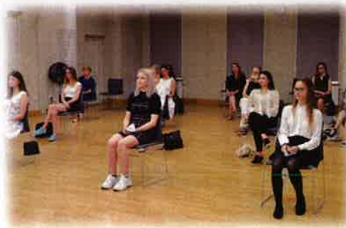
Gala 25 białostockiej edycji Samorządowego Konkursu Nastolatków „Ośmiu Wspaniałych”