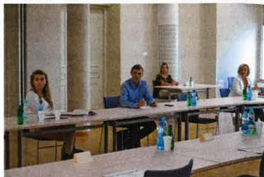
Posiedzenia Zespołu do spraw Budżetu Obywatelskiego w Białymstoku na 2021 rok