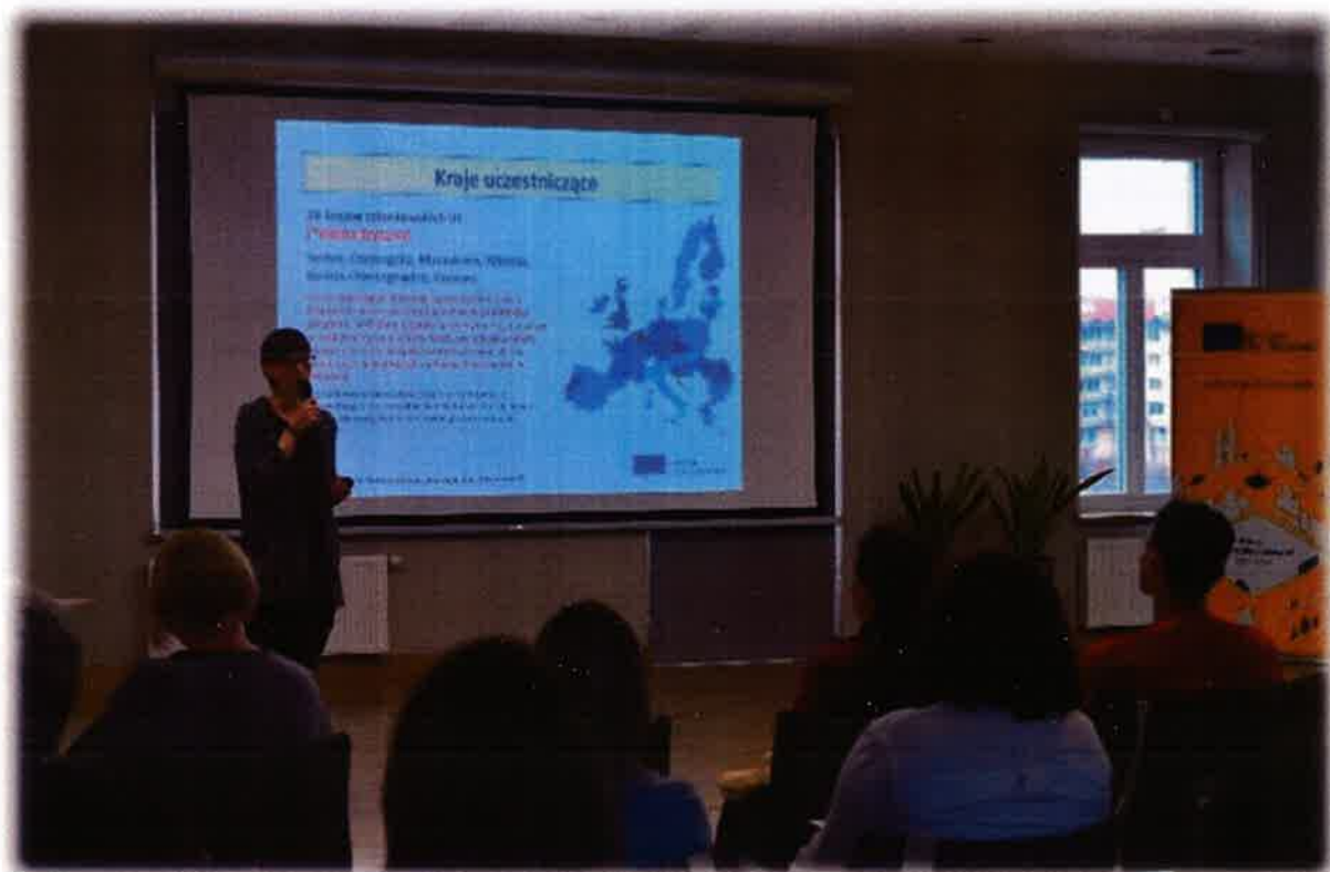
Seminarium „Europa dla Obywateli” w siedzibie Centrum Aktywności Społecznej przy ul. Św. Rocha 3

W związku z ogłoszonym stanem pandemii na obszarze całego kraju, budynek Centrum Aktywności Społecznej od 17 marca do 31 grudnia 2020 r. był zamknięty dla użytkowników.