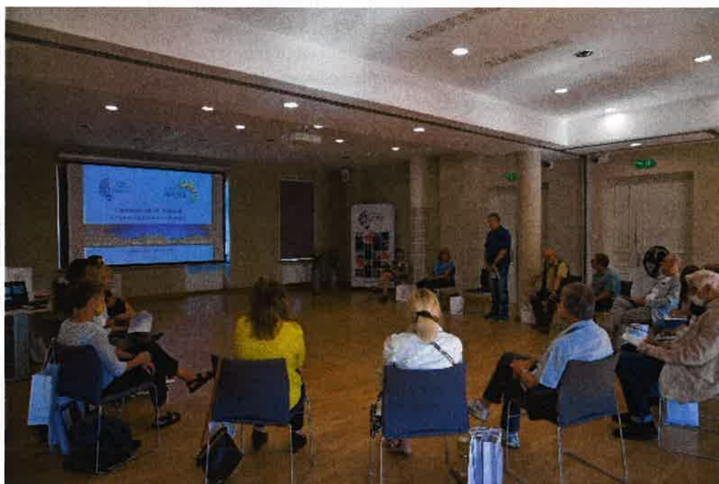
Wizyta w Białymstoku przedstawicieli samorządu i organizacji pozarządowych z Legionowa