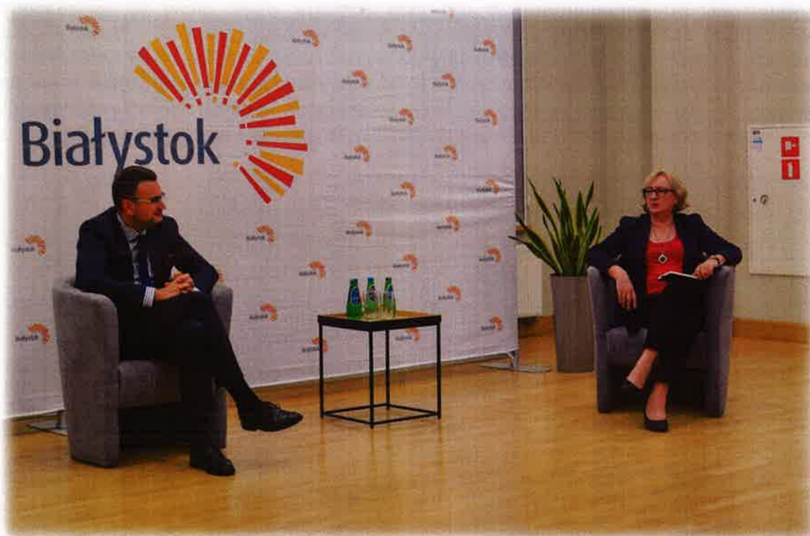
Forum Inicjatyw Społecznych Miasta Białystok „Odporne Miasto, Organizacje, Liderzy czyli jak wykorzystać kryzys do rozwoju”

Trzydniowy program Forum obejmował cykl debat, dyskusji oraz szkoleń dotyczących wzmacniania odporności i rozwijania relacji międzysektorowych w różnych aspektach.