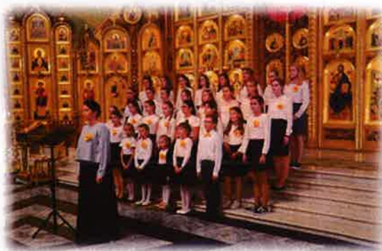
XXIV Białostockie Dni Muzyki Cerkiewnej realizator: Prawosławna Diecezja Białostocko-Gdańska