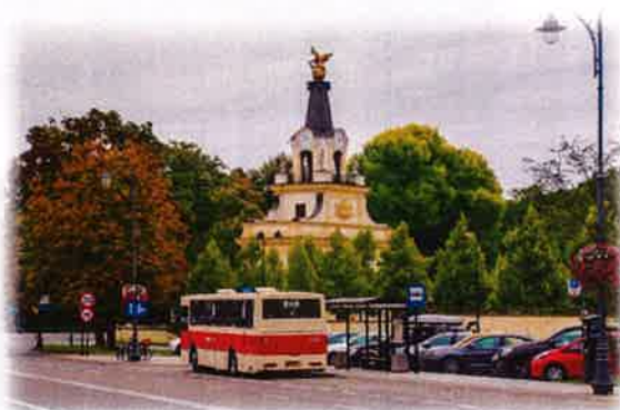
Projekt Klubu Miłośników Komunikacji Miejskiej w Białymstoku „Zabytkowymi autobusami po Białymstoku 2020”