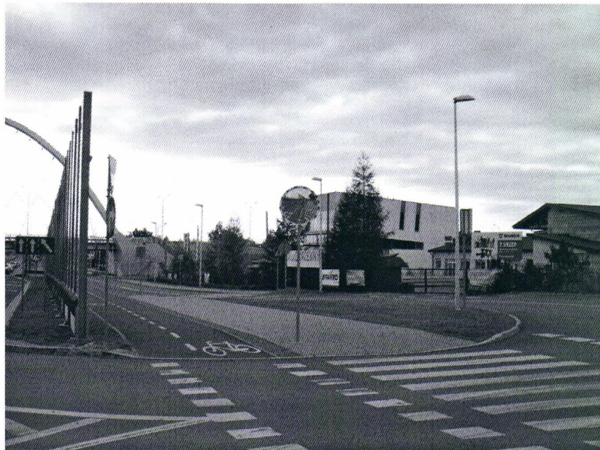
Widok na drogę serwisową od strony ul. Generała Andersa (wypukłe zwierciadło nieco wtapia się w otoczenie)