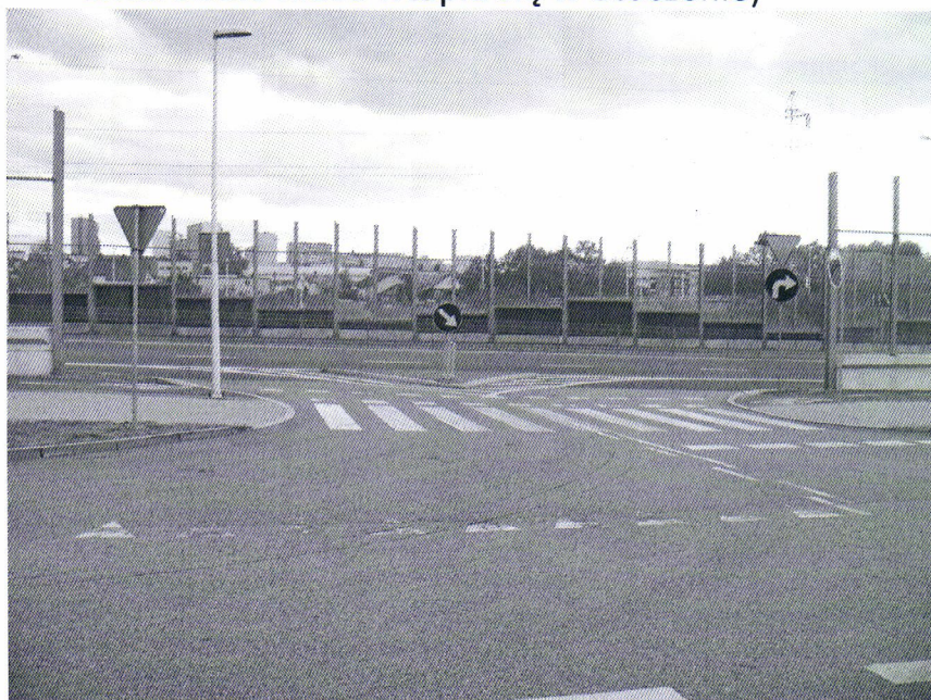
Widok na zjazd z ul. Generała Andersa od strony drogi serwisowej