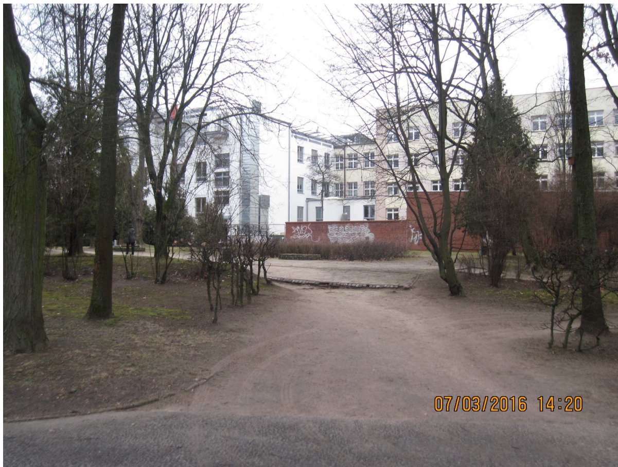
Miejsce lokalizacji pomnika „Inki” w widoku od strony głównej alei parkowej.

Obecny stan zagospodarowania terenu objętego opracowaniem konkursowym przedstawia mapa zamieszczona w załączniku B-4 oraz dokumentacja fotograficzna przedstawiona w załączniku B-8 do Regulaminu . Istniejące w granicach tego terenu elementy zagospodarowania – tj.: utwardzony plac, rabaty, murki, schody terenowe, pochylnia – znajdują się z stanie technicznym, wskazującym na znaczny stopień ich zużycia.